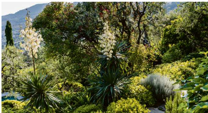
Le jardin privilégie une flore peu gourmande en eau. ATELIER JEAN MUS

Bon sens. Une façon de créer «un lien naturel entre minéral et végétal». «J'ai fait le choix de respecter les collines de Grasse : tout est à sa place, on n'a rien dérangé, la maison était déjà bien orientée», décrit le natif du pays des parfumeurs, installé non loin, à Cabris. Les circulations, le parc à voiture, l'ombrelle, la piscine, tout ça devait paraître le plus naturel possible. Pour aménager le domaine, le «poète des jardins», comme il est