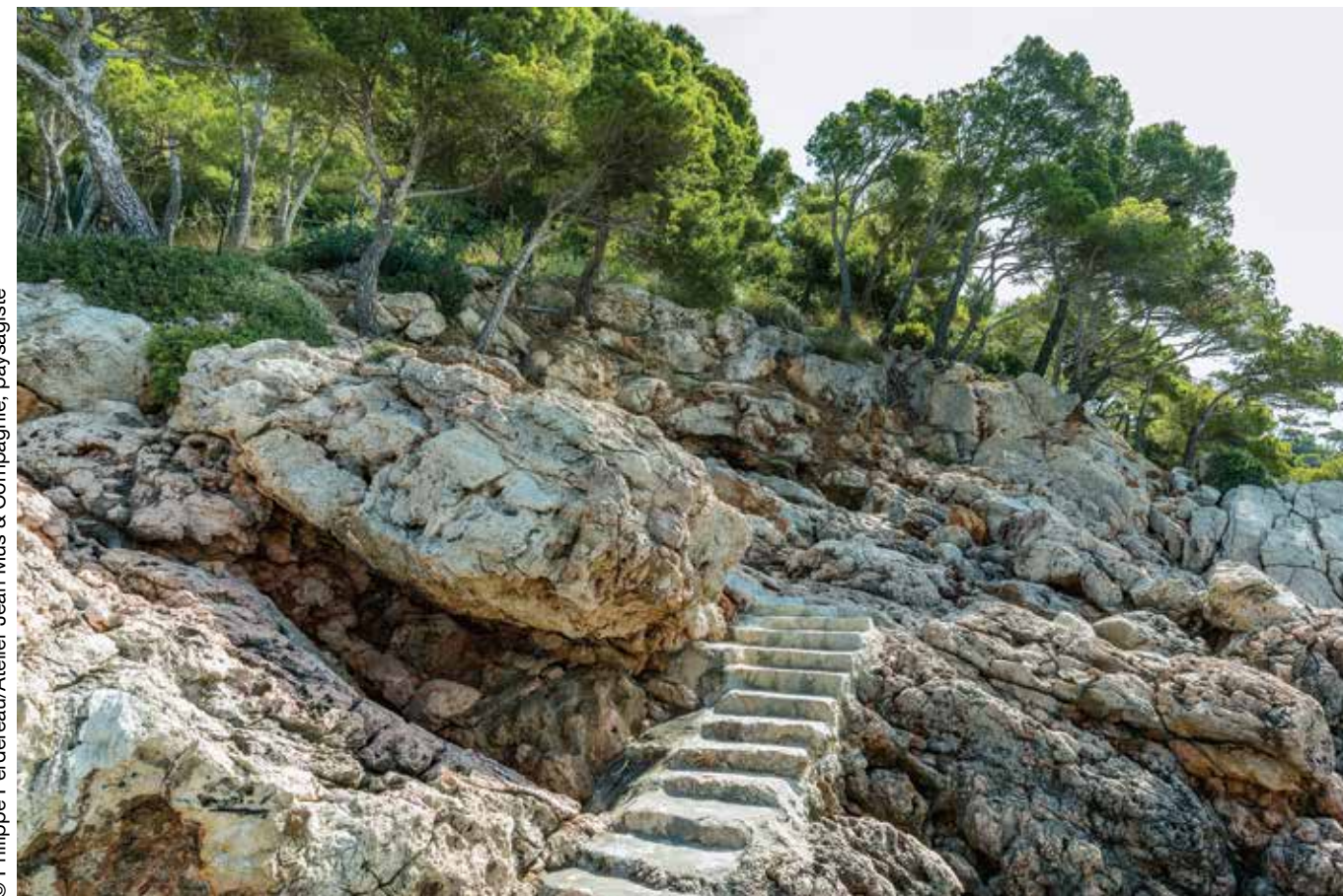
© Philippe Perdereau/Atelier Jean Mus & Compagnie, paysagiste