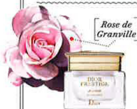
Rose de Granville

Incarnant toutes les facettes de la féminité, la fleur est l'indétrônable idole de la mode, de la joaillerie et de la beauté.