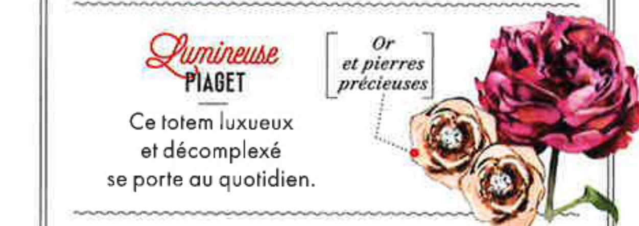
Or et pierres précieuses

L'association des boutons de rose de Damas à une huile biologique.