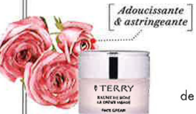
Adoucissante & astringente

Ce totem luxueux et décomplexé se porte au quotidien.